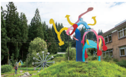
「オレの歌をきいてくれ～水の女王が創った輪舞曲～」田島征三 "Listen to my song, The Rondo by the queen of water" Tashima Seizo