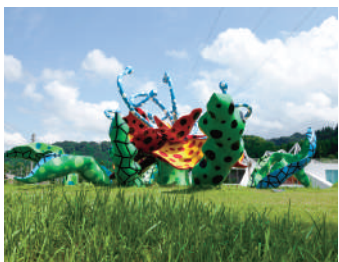
「花咲ける妻有」草間彌生 "Tsumari in Bloom" Kusama Yayoi