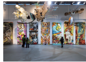
「青空があでしよう」三宅感 "There Will Be Blue Sky" Miyake Kan

Miyake Kan "Neutral Person" will be on view until 6/22(Sun) due to popular demand; "Neutral Person Spring" will be newly exhibited from 4/26(Sat). *Talk events will be held on 4/26(Sat).