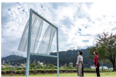
「たくさんの失われた窓のために」内海昭子 "For Lots of Lost Windows" Utsumi Akiko