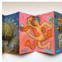
「ちきゅうパスポート」 "Earth Passport"