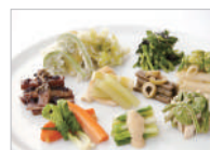
越後まつだい里山食堂 Echigo-Matsudai Satoyama Shokudo

The museum will be open for 10 days only under the title of "Ubusuna 10 Days". In spring, the museum will offer a special lunch of wild vegetables, using a variety of freshly harvested wild vegetables.