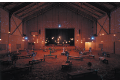
「最後の教室」クリスチャン・ボルタンスキー＋ジャン・カルマン "The Last Class" Christian Boltanski + Jean Kalman