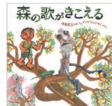
「森の歌が聞こえる」 "Hear the forest singing"

*A talk event by Tajima Seizo is scheduled to be held during the exhibition period. Details including the schedule will be announced on the official website. *Part of the exhibition will be closed from 5/15(Thu)-5/23(Fri) due to the exhibition change period. The permanent exhibition will be open to the public.