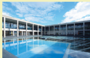
・越後妻有里山現代美術館 MonET Museum on Echigo-Tsumari, MonET

・たくさんの失われた窓のために For Lots of Lost Windows