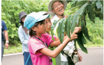
棚田バンクイベント Matsudai Tanada Bank event

Let's learn how to make butterbur sprout miso with local woman. Date & Time: 4/27(Sun), 5/3(Sat) 10:30-12:00(Time required: 1.5 hours) Fee: Adults ¥1,500, Children ¥1,000(6-15 years old) *Reservations required