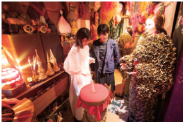
「黄金の遊戯場」豊福亮 "Golden Playroom" Toyofuku Ryo