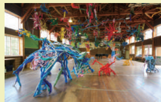
・鉢&田島征三 絵本と木の実の美術館 Hachi & Seizo Tashima Museum of Picture Book