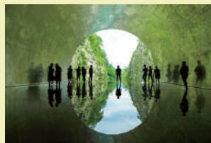
・清津峡渓谷トンネル「Tunnel of Light」 Kiyotsu Gorge Tunnel "Tunnel of Light"