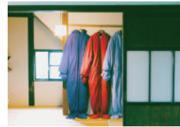
夢の家 Dream House

☆Open on different days depending on the season.