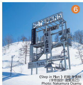
《Step in Plan》約翰·老舍林 (字形設計: 瀧澤亮吉)